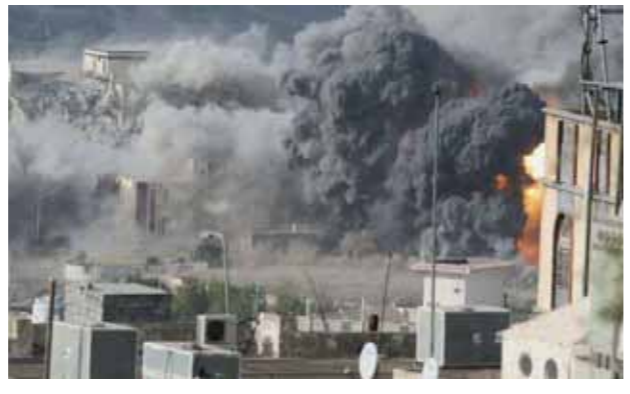
تصوير جوي لمدن تعز ومارب التي يشنها العدوان السعودي الغاشم

تكفيرية وتعبوية خاطئة.. مستعلة جهل القرويين خاصة.. مستغرفةً لنخوتهم وعاطفتهم الجياشة وبساطتهم الممتدة من أثر «الإيمان يمان والحكمة يمانها»، مما جعل اليمن مسرحاً لتجارب المعتوهين من كثير جنسيات لا هم لها سوى تشغيل مخرجاتها الدينية في دماء اليمنيين وقولهم.. والحديث يطول حول هذا الجرح الزائف المفتوح إلى ما لا نهاية إن لم نع ما نحن قاصدون عليه. واليمن بها ما بها من بلاء وتعب . وإن لم يلتفت الجميع لتحقيق أوليات أحلام الجيل القادم سندم مستقبلاً على كل فترة زمنية أضاعناها في زخريعات السياسة والمكاييد الخبيثة . والتعليم هو طوق الخلاص من نكبة الجهل والتخلف .. وهو الفرصة المثلى لتفقيه الجيل وتأهيله ليصبح واعياً ومُنتجاً ومفكراً بحلول عملية لهيضة بلده بدلاً من هدم ما تبقى بهذا الوطن . إن يبقى التعليم هو الوعاء الحقيقي لمصب وطريق المستقبل .. وهو الرهان الأعظم للجيل القادم لمواكبة العصر الحديث والخروج من فوضى الأحقاد والانتماءات الضيقة.